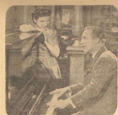
El popular crooner BIG CROSBY entona una canción acompañándose al piano. La que apoya en el piano le escucha embalsada es la actriz LOUISE CAMPBELL.