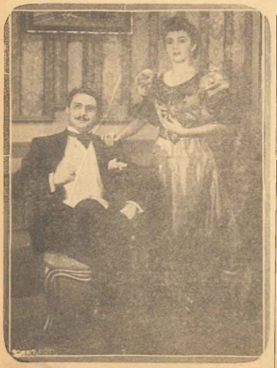
en un momento de la película "LOS MUCHACHOS DE ANTES NO USABAN COMINA"